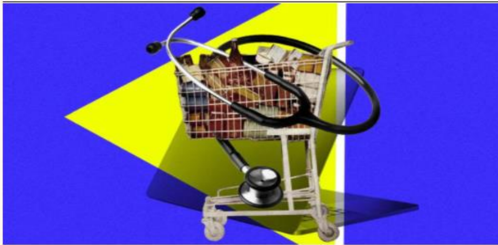
▲ Illustrazione di Laura Cattaneo/Il Sole 24 Ore

Una dose massiccia di smart working e la caduta verticale dell'occupazione in alcuni settori. L'emergenza sanitaria causata dal Covid da un lato ha reso il lavoro agile il protagonista assoluto del mercato del lavoro tanto che per molti italiani continua ad essere la regola fino al 15 ottobre (quando è fissata la scadenza dello stato di emergenza, che probabilmente verrà prorogato fino al 31 dicembre). Dall'altro lato ha prodotto una forte crisi del mercato del lavoro: da febbraio la platea degli occupati ha perso, secondo l'Istat, circa 600mila persone e si è registrato un aumento degli inattivi di oltre 700mila unità.